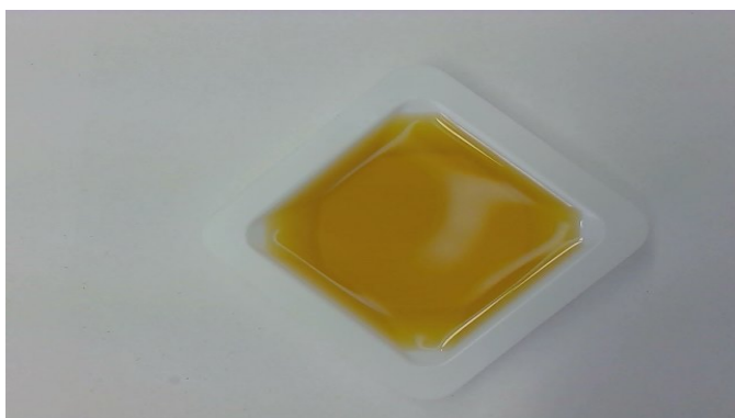
Bild der eingelangten Probe vom 04.04.2022