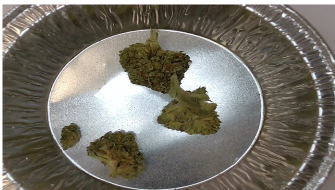
Bild der eingelangten Probe vom 09.05.2022