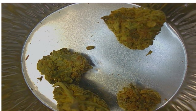
Bild der eingelangten Probe vom 02.05.2022