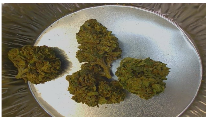
Bild der eingelangten Probe vom 02.05.2022