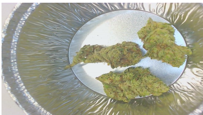
Bild der eingelangten Probe vom 22.04.2022