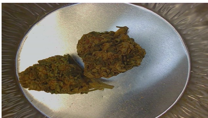
Bild der eingelangten Probe vom 02.05.2022