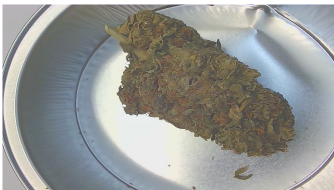
Bild der eingelangten Probe vom 20.04.2022