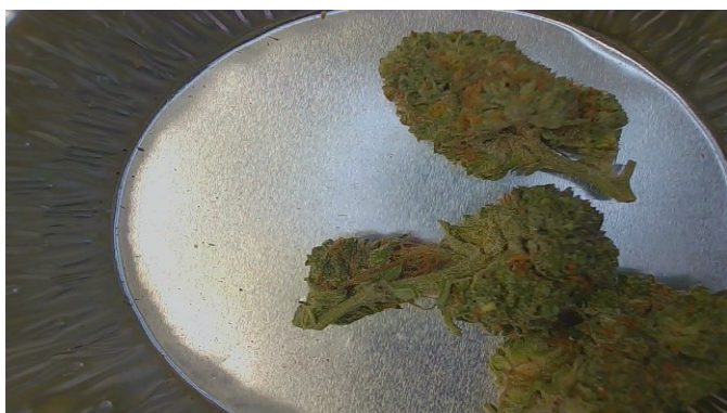
Bild der eingelangten Probe vom 02.05.2022