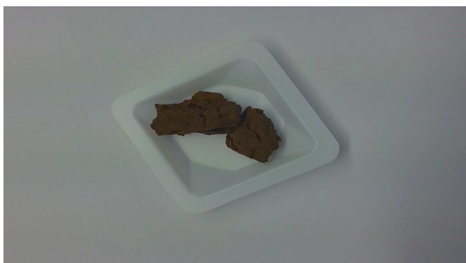
Bild der eingelangten Probe vom 02.05.2022