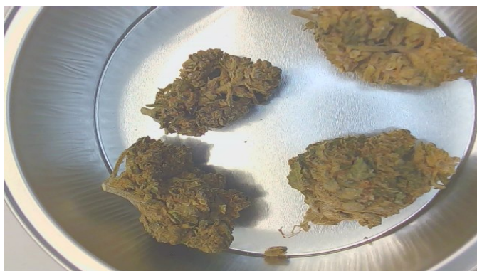
Bild der eingelangten Probe vom 20.04.2022