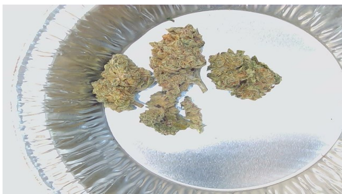
Bild der eingelangten Probe vom 09.05.2022