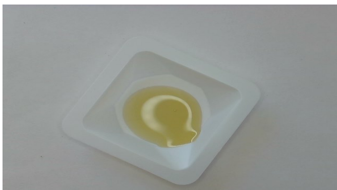
Bild der eingelangten Probe vom 19.05.2022