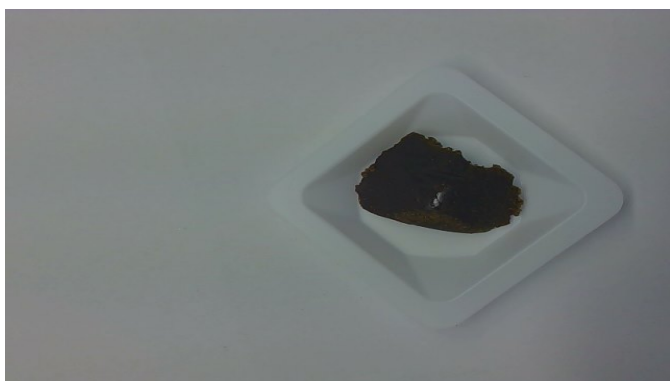
Bild der eingelangten Probe vom 02.05.2022