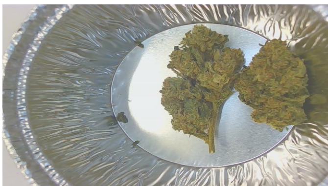
Bild der eingelangten Probe vom 22.04.2022