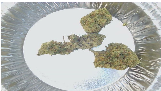
Bild der eingelangten Probe vom 09.05.2022