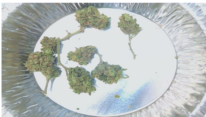
Bild der eingelangten Probe vom 09.05.2022